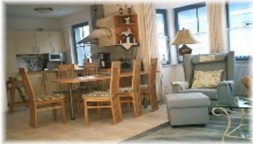
Küche - Essecke

Fußweg zum Strand 3 Minuten, zur verkehrsberuhigten Flaniermeile 2 Min.