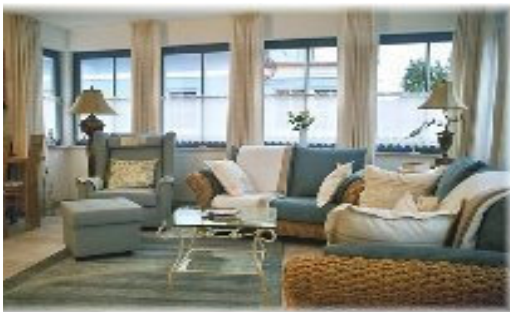
Wohnraum - Ambiente

Im Kavelhus finden Sie im Erdgeschoß einen großzügigen Wohn- Essbereich, mit Einbauküche die alle Wünsche erfüllt. Hier ist der Großraum-Kühlschrank genauso selbstverständlich wie die Mikrowelle und der Kartoffelschäler.