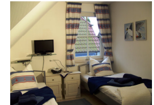
Klabauterkammer (mit Flachbild- Fernseher)

2 weitere Personen finden im 3. Schlafzimmer (Möwennest im Dachgeschoss) Platz.